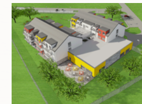
Zindywidualizowana opieka, dostosowana do potrzeb

W ramach I etapu planowanych prac wykonane zostaną roboty ziemne, fundamenty, stropy i ściany (poziomy 0-2), schody żelbetonowe, szyb windowy, konstrukcja oraz pokrycie dachu, a także stolarka okienna. Wstępny koszt realizacji I etapu (stan surowy zamknięty) oscyluje w granicach 3 324 599,07 PLN .