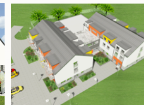
Atrakcyjna lokalizacja, nieopodal lasu