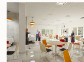
Przygotowana i życzliwa kadra pracowników

Efektywne kontynuowanie przedsięwzięcia uzależnione jest od dalszego wsparcia ze strony darczyńców , zarówno instytucjonalnych, jak i osób fizycznych. Wsparcie to wyrazić można poprzez przekazanie 1% podatku na rzecz Stowarzyszenia Jordan - będącego organizacją pożytku publicznego - lub poprzez dowolną wpłatę na rachunek bankowy Stowarzyszenia.