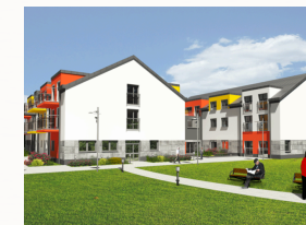
Funkcjonalna infrastruktura socialna

Stowarzyszenie posiada korzystnie zlokalizowaną działkę pod inwestycję , przygotowaną do rozpoczęcia I etapu prac budowlanych. Nadto, przygotowano kompleksowe projekty inwestycji , zgodne z obowiązującymi przepisami prawa oraz praktycznymi wymogami profilu planowanej działalności, a także pozyskano już pozwolenie na budowę .