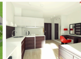
Dbłość o szczegóły, wysoki standard pomieszczeń