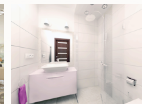
Sanitariaty dopasowane do potrzeb pensjonariuszy